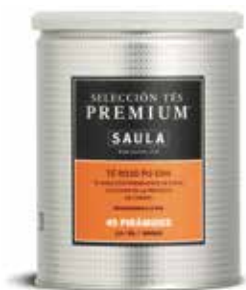
TE VERMELL PU-ERH 45 Piràmides 2,5 / 3 gr.