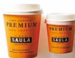
Gots Take Away