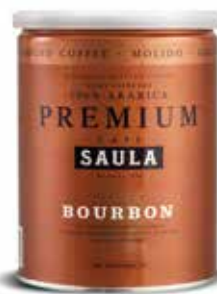
PREMIUM BOURBON Gran Espresso Premium Natural 100% aràbica Pot 250 gr. molgut