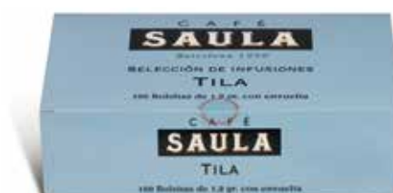
TIL-LA 100 bossetes