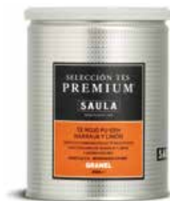
TE VERMELL PU-ERH TARONJA I LLLIMONA Granel 250 gr.