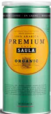
PREMIUM ECOLÒGIC GRA Gran Espresso Premium Ecologic 100% aràbica / Pot 500 gr. en gra