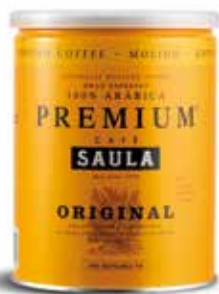
PREMIUM ORIGINAL Gran Espresso Premium Natural 100% aràbica Pot 250 gr. molgut