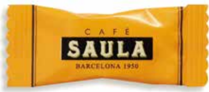
SUCRE BLANC REFINAT 1.500 sobrets "stick" de 6 gr./caixa