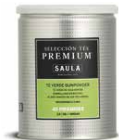
TE VERD GUNPOWDER 45 Piràmides 2,5 / 3 gr.