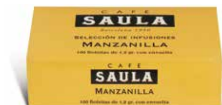
CAMAMILLA 100 bossetes