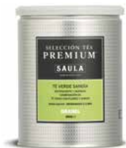
TE VERD SÍNDRIA Granel 250 gr.