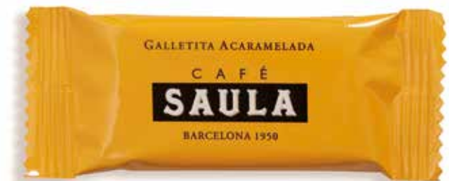
GALETA CARAMEL-LITZADA 300 galetes de 6,25 gr./caixa