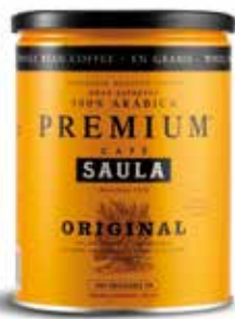
PREMIUM ORIGINAL GRA Gran Espresso Premium Natural 100% aràbica Pot 250 gr. en gra