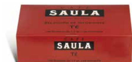
TE 100 bossetes