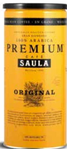
PREMIUM ORIGINAL GRA Gran Espresso Premium Natural 100% aràbica / Pot 500 gr. en gra