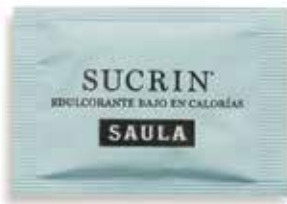
EDULCORANT Baix en calories (2 Kcal) 150 sobrets/caixa