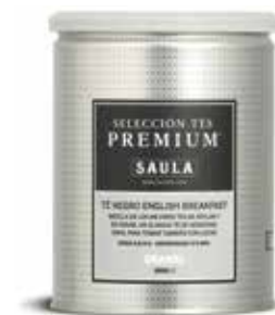
TE NEGRE ENGLISH BREAKFAST Granel 250 gr.