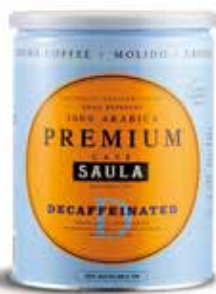
PREMIUM DESCAFEÏNAT Gran Espresso Premium Decafeïnat 100% aràbica Pot 250 gr. molgut