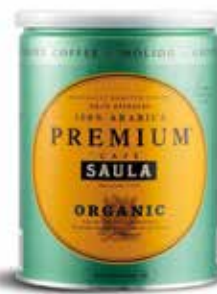
PREMIUM ECOLÒGIC Gran Espresso Premium Ecologic 100% aràbica Pot 250 gr. molgut