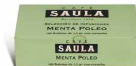
MENTA POLIOLIOL 100 bossetes