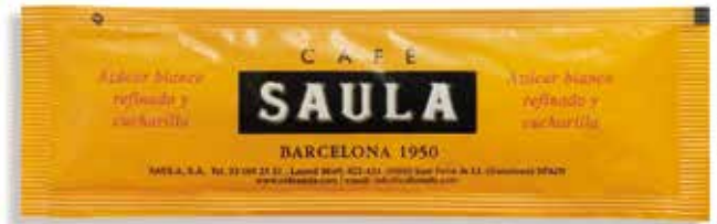
SUCRE BLANC REFINAT 1.500 sobrets de 7 gr./caixa